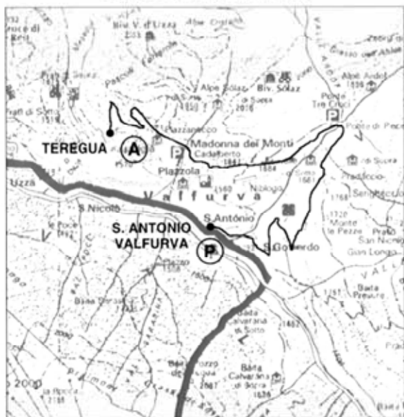
CARTINA PERCORSO Stravalfurva 2007